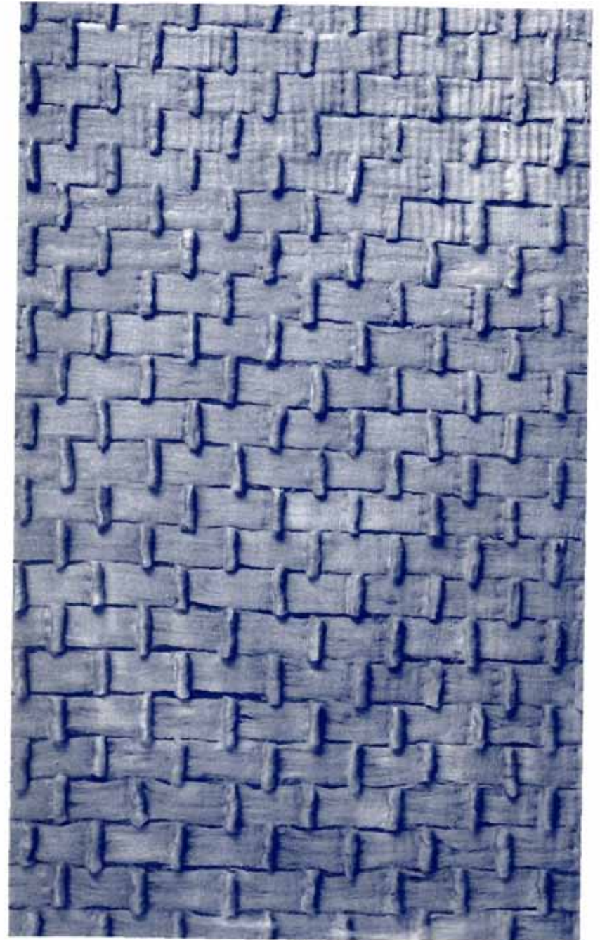
mare di ferro