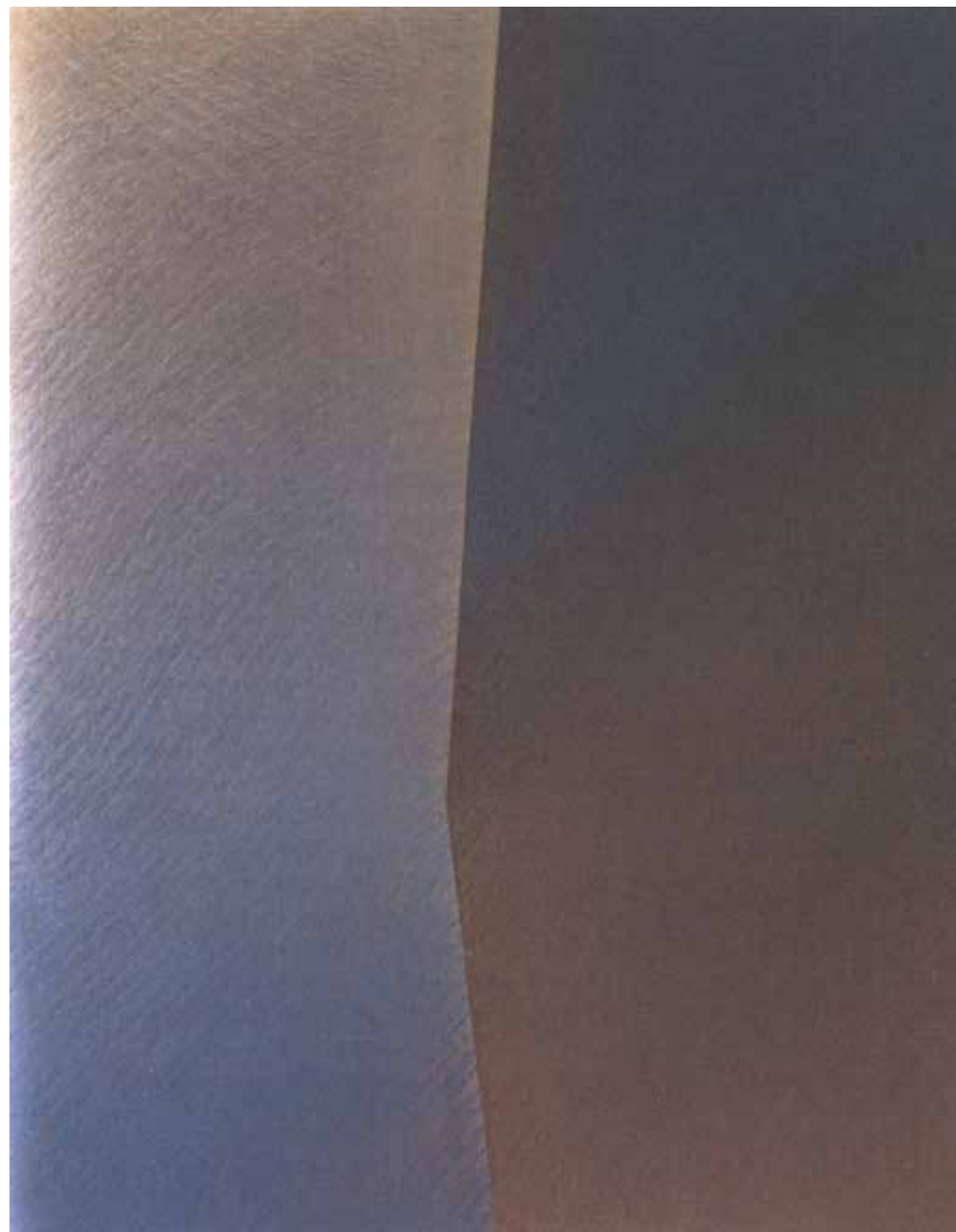
Senza titolo, olio su tela 1989-90 cm 120x150

Il processo di interpolazione dei due universi semantici avviene gradualmente, ma già i lavori degli anni Sessanta, caratterizzati da sperimentazioni aniconiche di matrice astratto-concreta, rivelano una precisa intenzionalità nel fondere le suggestioni naturalistiche