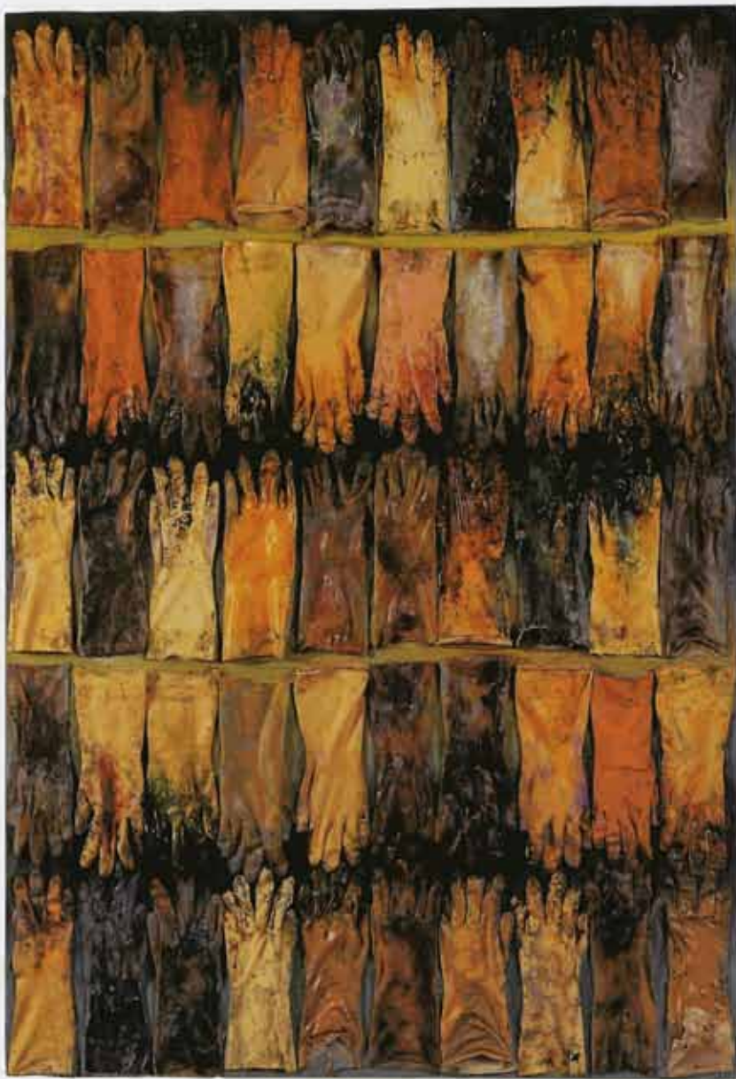
I guanti dell' incisore 1992 tecnica mista su compensato, cm 150 × 110